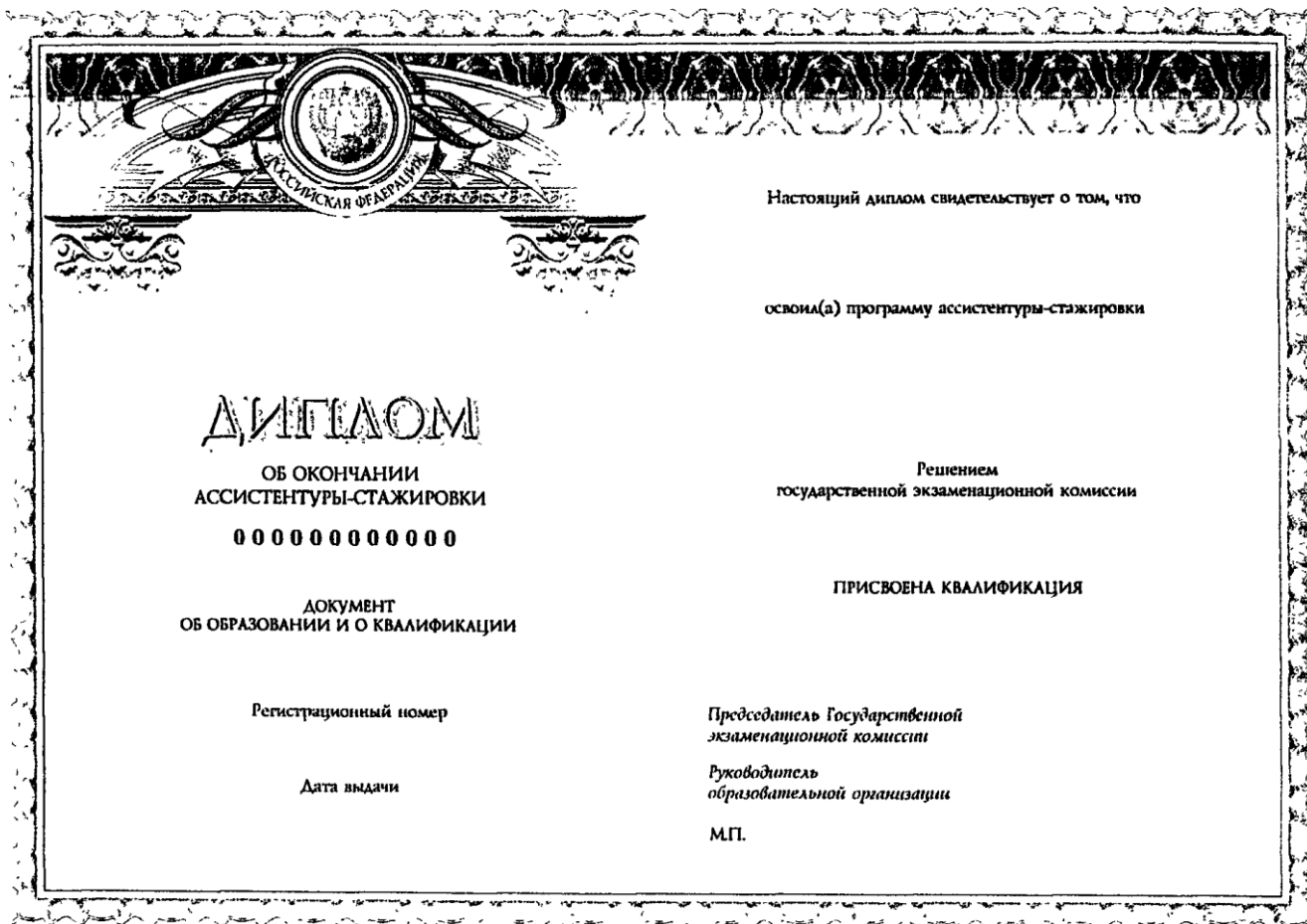
Рисунок оборотной стороны титула диплома